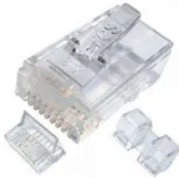
Rj45 Cat6 Gigalan Furukawa 30 peças