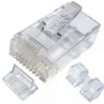
Rj45 Cat6 Gigalan Furukawa 25 peças